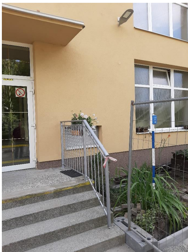
Obrázek 1 Půdorys dle katastru a fotodokumentace objektu a jeho střechy pro umístění FV elektrárny